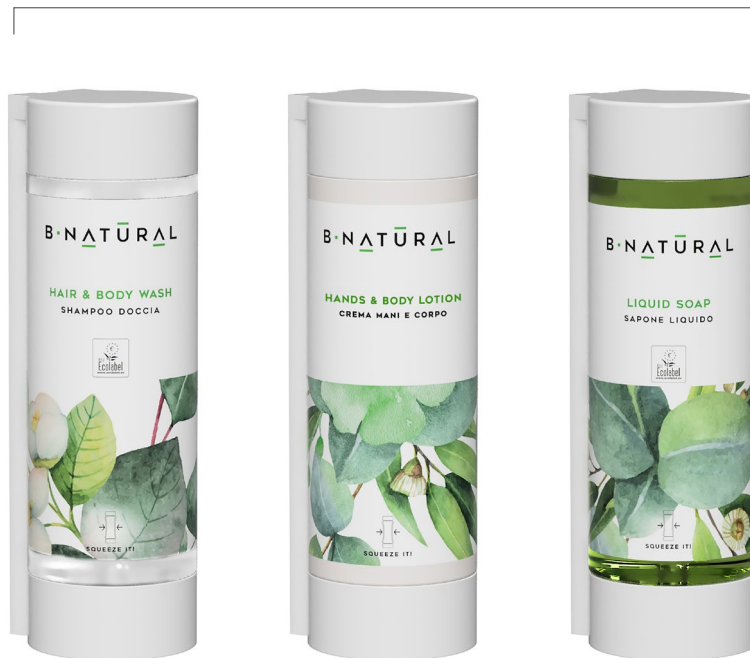
SHAMPOO DOCCIA hair&body wash 350 ml