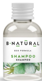
SHAMPOO shampoo 50 ml