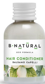
BALSAMO CAPELLI hair conditioner 50 ml