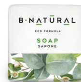
SAPONE soap 20 g