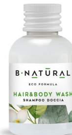
SHAMPOO DOCCIA hair&body wash 50 ml