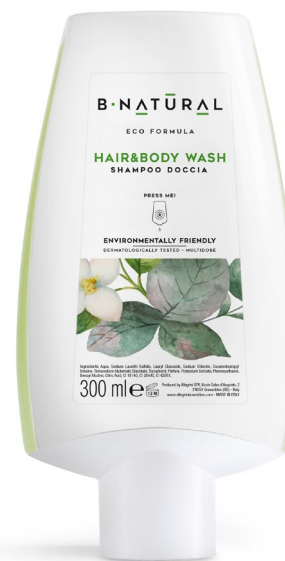
SHAMPOO DOCCIA hair&body wash 300 ml