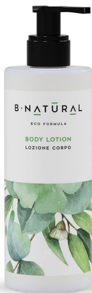
LOZIONE CORPO body lotion 300 ml