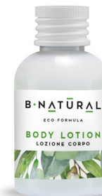
LOZIONE CORPO body lotion 50 ml