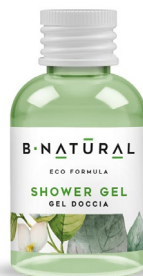
GEL DOCCIA shower gel 50 ml