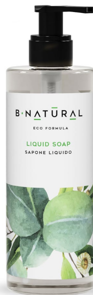
SAPONE LIQUIDO liquid soap 300 ml