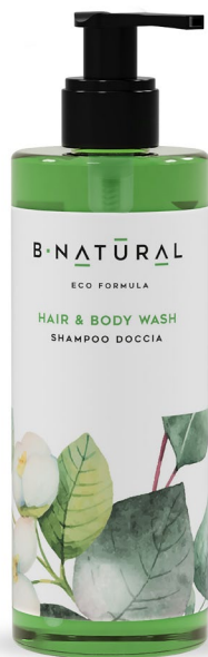
SHAMPOO DOCCIA hair&body wash 300 ml