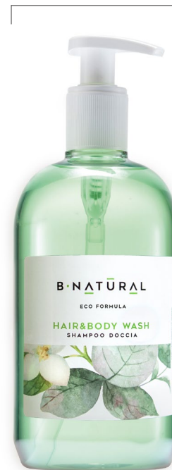
SHAMPOO DOCCIA hair&body wash 500 ml